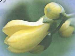
キレンゲショウマ