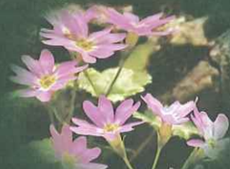
オオミネコサクラ